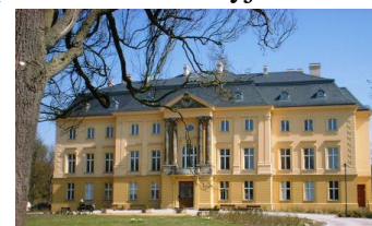
medikų draugijai, jis

Trebnitz yra miestelis, turintis lygiai 430 gyventojų ir didelį dvarą miestelio viduryje. Dvaro kompleksą sudaro keli pastatai. Didžioji dalis pastatų renovuoti ir „įdarbinti“. Didžiajame dvaro pastate įsikūrusios Jaunimo švietimo centro ir Socialinių pedagogų draugijos. Pastate nuolat vyksta edukacinės programos, skirtos jaunimui ir socialinių pedagogų praktikai. Šalia renovuotoje kalvėje įrengti viešbučio kambariai ir konferencijų salė. Dar vienas pastatas http://www.leaderlietuva.lt/uploads/images/trebnitz_web.jpg priklauso medikų draugijai, jis remontuojamas „Leader“ programos lėšomis. Taip pat pasinaudojus parama pagal šią programą įrengta ir automobilių stovėjimo aikštelė.